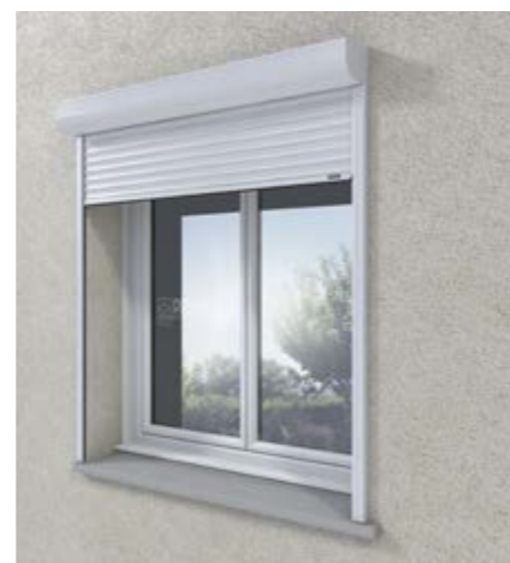
SOUS LINTEAU Enroulement vers l'extérieur